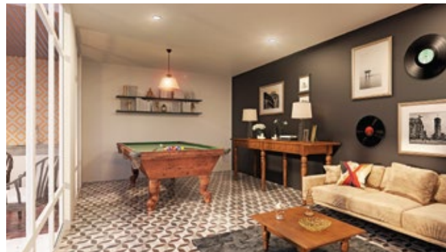
◆ Game Zone